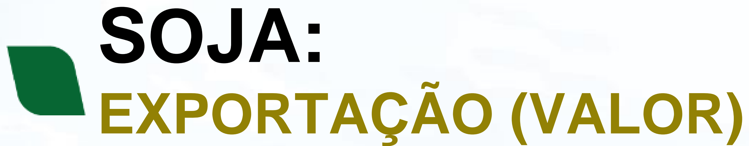
Soja - Exportação (Bilhões de Dólares Americanos - *2020/CPI)