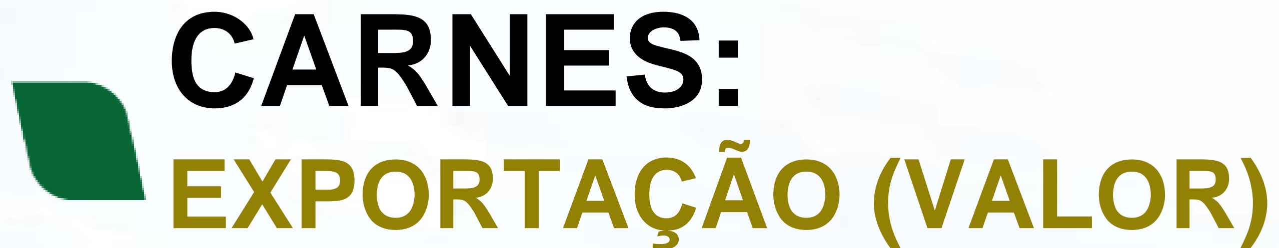
Carnes - Exportação (Bilhões de Dólares Americanos - *2020/CPI)