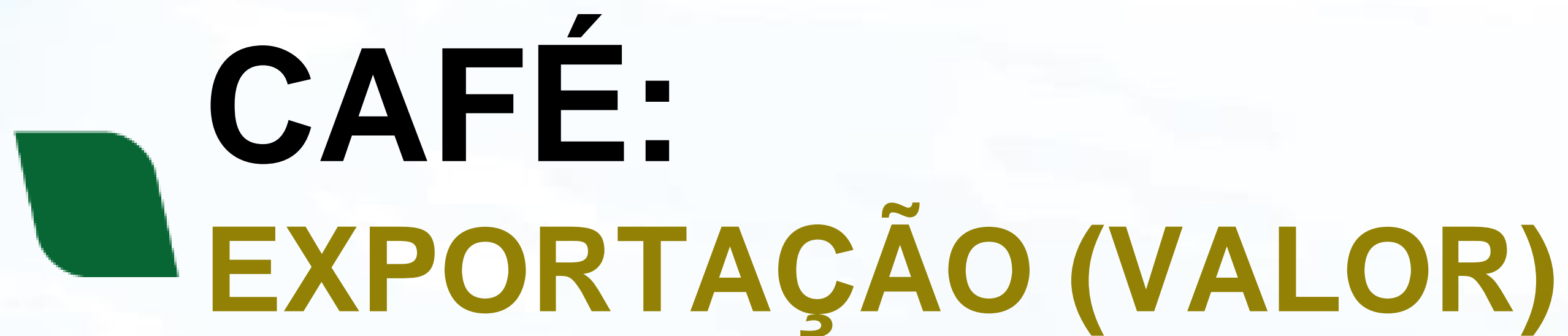
Café - Exportação (Bilhões de Dólares Americanos - *2020/CPI)