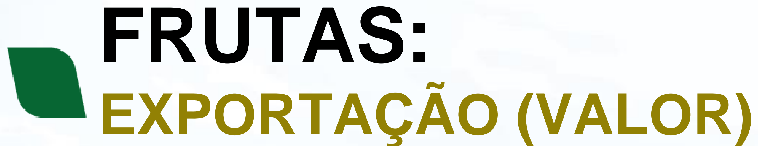
Frutas - Exportação (Bilhões de Dólares Americanos - *2020/CPI)