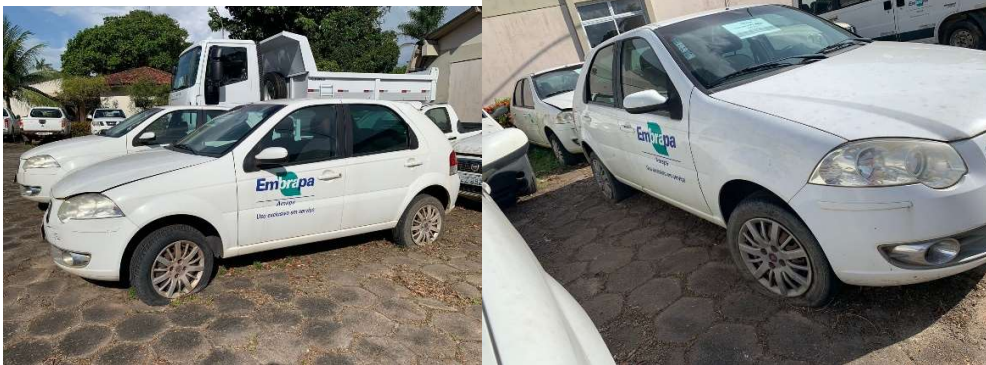
LOTE 07 – Veículo (L200 Placa NEM 0261) – 8.000,00