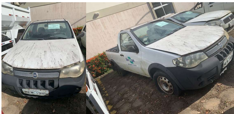
LOTE 01 – Veículo (Fiat Strada – New 1989) – R$ 4.000,00