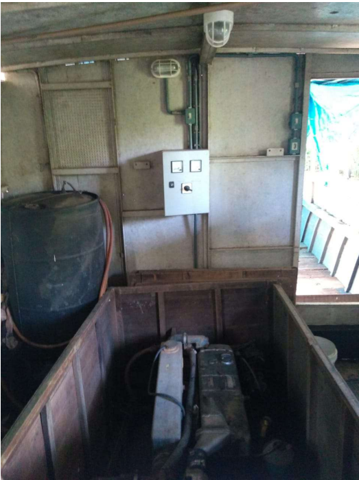
LOTE 13 – Grupo gerador/Quadro Gerador – R$ 12.200,00