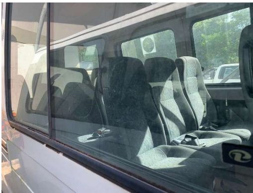
LOTE 03 – Veículo (L200 Placa NEM 1259) – R$ 8.000,00