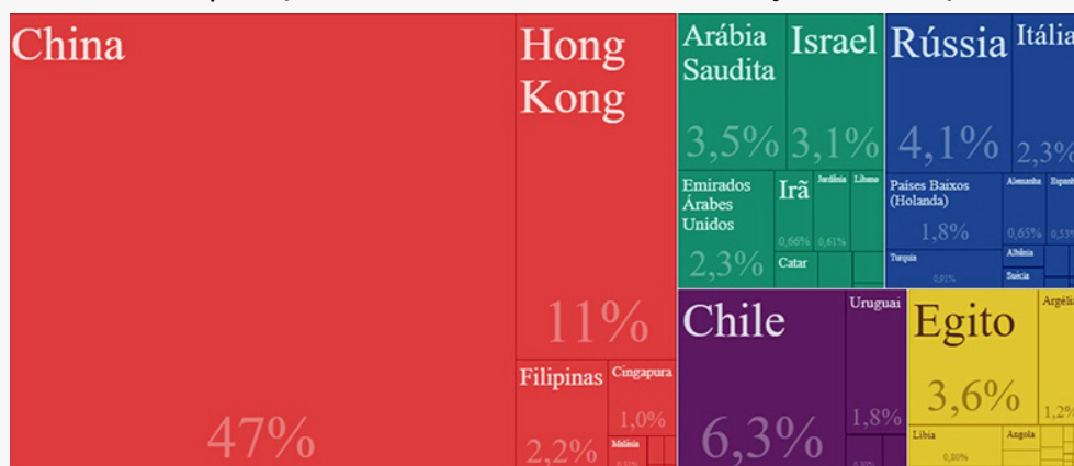
Destinos das exportações brasileiras de carne bovina entre janeiro e março de 2020